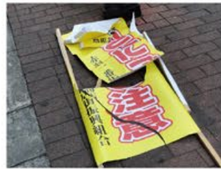
壊された「客引き注意」看板

赤羽一番街・赤羽駅周辺において、毎日、悪質な客引きが出没しています。商店街振興組合を中心に看板設置、啓発放送など、必死の対策をとっていますがまだまだ被害が深刻です。