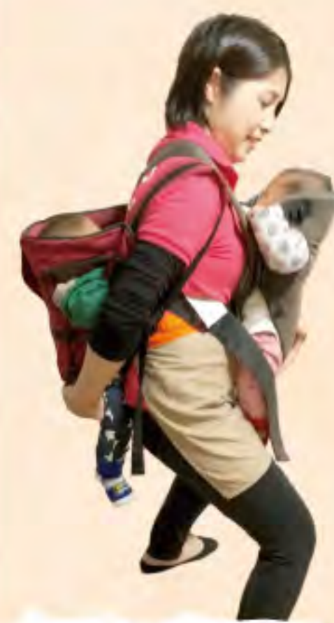
双子ママ体験！ 3時間で腰が痛い

多胎の妊娠・出産は、 ハイリスク 。 お腹に二人以上の赤ちゃんがいるので、赤ちゃんが低体重になりやすく、 出産後は新生児集中治療室に入ることも珍しくありません。